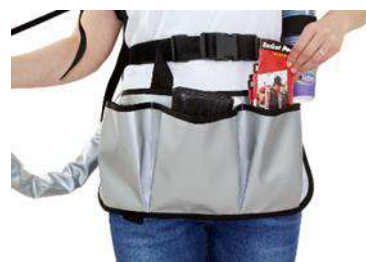
Tablier de vendeur incl. 3 sacs avant