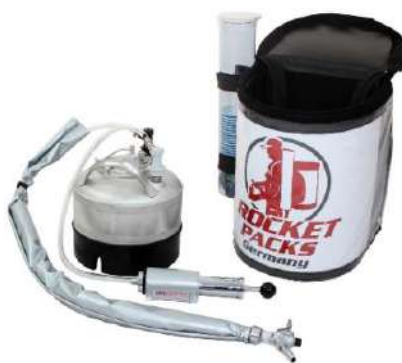
Pompe à air manuelle comme équipement sous pression