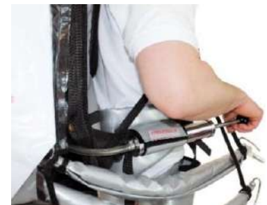
Pompe à air manuelle comme équipement sous pression