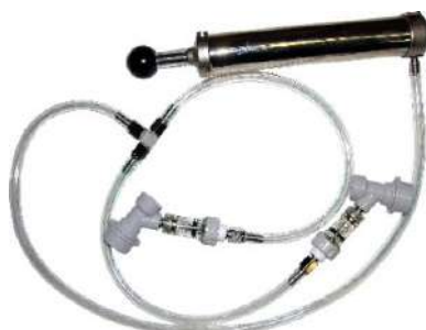
Pompe à air avec connecteur en T