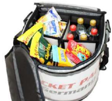
Incrustation (diviseur de pièce), garde le plateau bien rangé