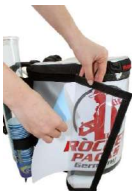
Décoration publicitaire flexible par insertion de papier derrière une feuille