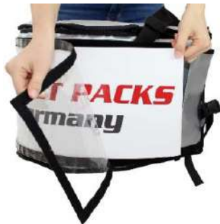
Changement flexible de messages publicitaires