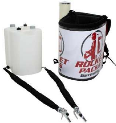
Illustration : caractéristiques du produit pour les boissons non gazeuses