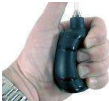
Mini pompe à air