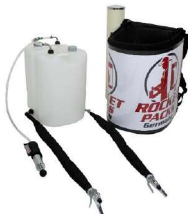
Illustration : caractéristiques du produit pour boissons gazeuses