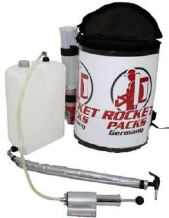
Illustration : Caractéristiques du produit pour boissons non gazeuses