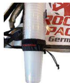
Distributeur de gobelets universel pour gobelets jetables et réutilisables

...de préférence adapté pour les boissons fraîches !