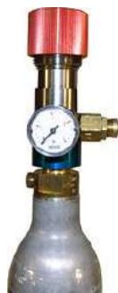
Article RP1102GN Régulateur de CO2 pour Soda-Club bouteille (Aluminium)