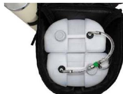
Pompe avec connecteur en T attaché vers l'article Kombi 2x 15 litres