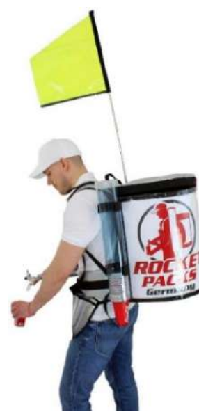
Promo-Drapeau avec Twin-Pack