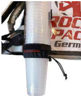
Distributeur de gobelets universel pour gobelets jetables et réutilisables