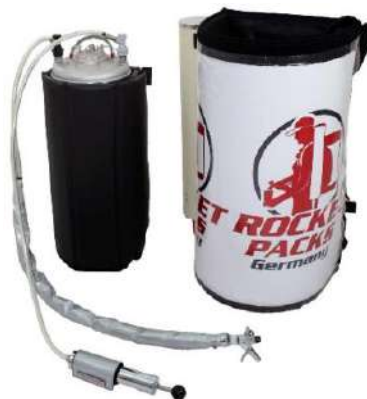
Illustration : caractéristiques du produit pour boissons gazeuses