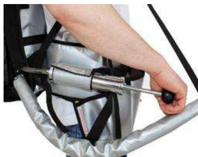
Pompe à air manuelle comme équipement sous pression

* Autres accessoires de pression sur demande*