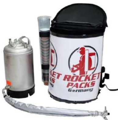
Illustration : caractéristiques du produit pour les boissons non gazeuses