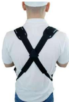
Système de bandoulière ergonomique avec épaulement réglable

Particulièrement adapté pour une utilisation avec des canettes et des bouteilles de 500 ml !