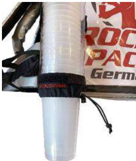
Distributeur de gobelets universel pour gobelets jetables et réutilisables