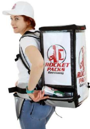
Échangeable flexible messages publicitaires !