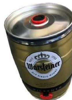
Canette de bière de 5 litres