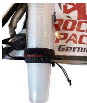
Distributeur de gobelets universel pour gobelets jetables et réutilisables