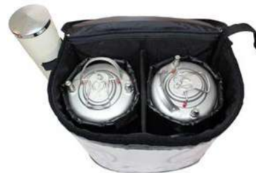
2 isolés séparément contenant de boisson 11 litres