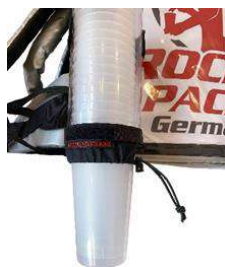
Distributeur de gobelets universel pour gobelets jetables et réutilisables