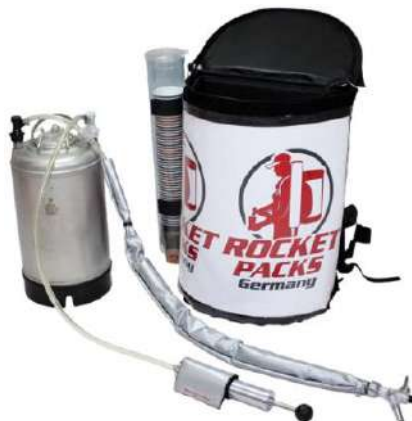
Illustration : caractéristiques du produit pour boissons gazeuses