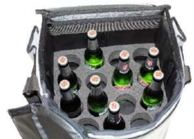
Trou Ø 70 mm, Hauteur 50 mm