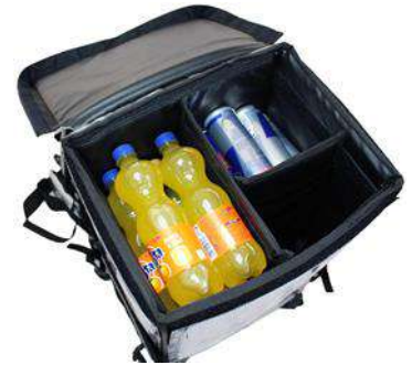
Appareil à 2 chambres avec une capacité de chargement de 15 canettes ou bouteilles jusqu'à 500 ml chacun