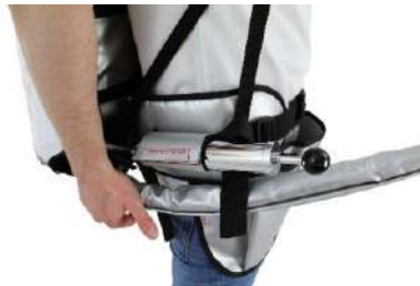
Pompe à air manuelle attachée au harnais du sac à dos