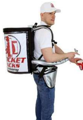
Pro 11 litres, assure une apparence de marque professionnelle

Sac à dos professionnel pour boissons Isolation jusqu'à 4 heures