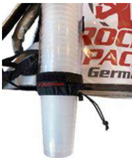
Distributeur de gobelets universel pour gobelets jetables et réutilisables