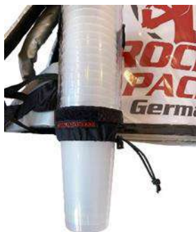
Distributeur de gobelets universel pour gobelets jetables et réutilisables