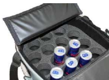
Trou Ø 70 mm, Hauteur 50 mm