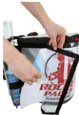
Décoration publicitaire flexible par impressions papier derrière une feuille