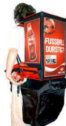
Twin-Pack incl. Sac à déchets