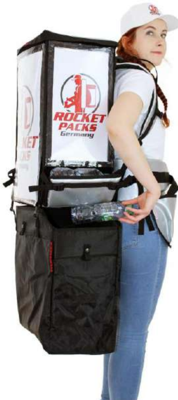
Twin Pack avec sac poubelle pour se vider

Demandez-nous simplement des solutions et des prix.