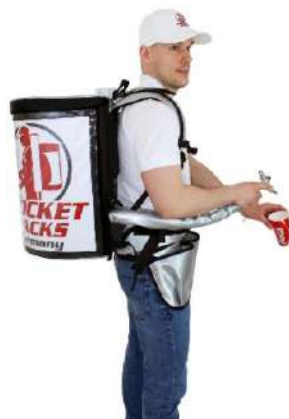
Pro 11 litres, assure une apparence de marque professionnelle

Sac à dos professionnel pour boissons Isolation jusqu'à 4 heures