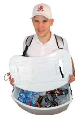
Couvercle coulissant amovible