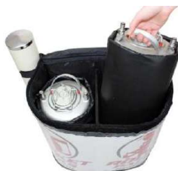
2 isolés séparément contenant de boisson 11 litres