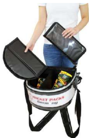
Couvercle relevable complètement amovible