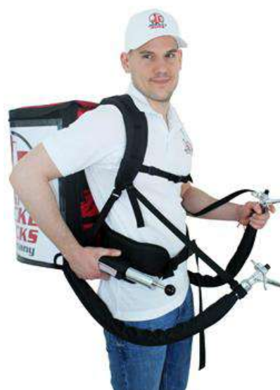
Sac à dos léger

En utilisant la pompe à air également adaptée au fonctionnement au CO2 !