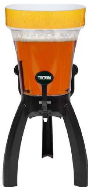
Classique 5 litres