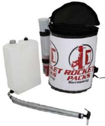
Illustration : Caractéristiques du produit pour boissons non gazeuses