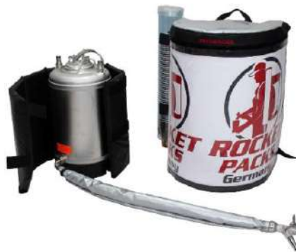
Illustration : caractéristiques du produit pour les boissons non gazeuses