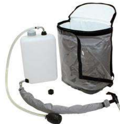
Illustration : caractéristiques du produit pour boissons gazeuses