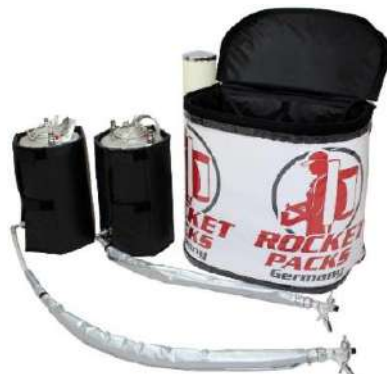
Illustration : caractéristiques du produit pour les boissons non gazeuses