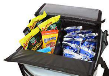
Incrustation (diviseur de pièce), garde le plateau bien rangé