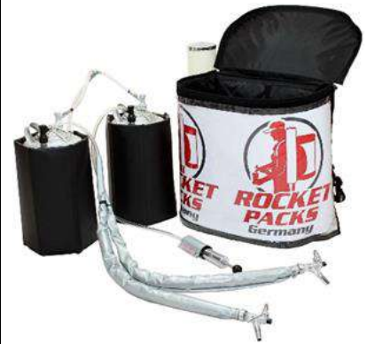
Illustration : caractéristiques du produit pour boissons gazeuses