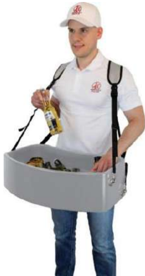
Illustration hors. Foil-Sac

- Plateau de vendeur applicable flexible en tout plastique -