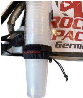
Distributeur de gobelets universel pour gobelets jetables et réutilisables