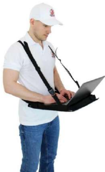
Modèle standard du système de ceinture

Norme de support d'ordinateur portable pour appareils 11"- 14"