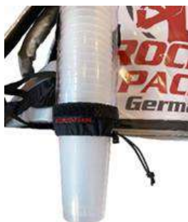
Distributeur de gobelets universel pour gobelets jetables et réutilisables