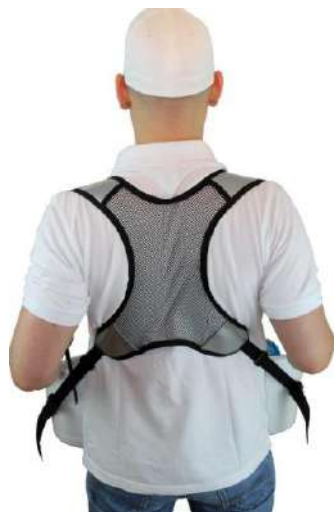
Ergonomique 4 points bretelles

Idéal pour les glaces et autres produits surgelés !