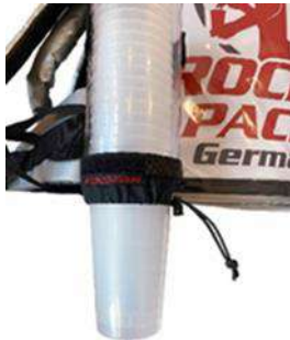
Distributeur de gobelets universel pour gobelets jetables et réutilisables