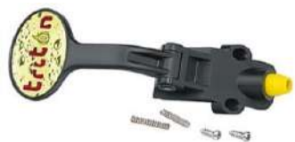
Taper avec des vis