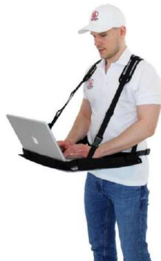
Système de ceinture Modèle XL

Laptop-Supporter XL pour appareils 15"- 18"