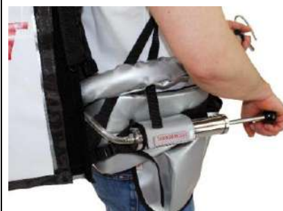
Pompe connectée à l'article Premium 11 litres