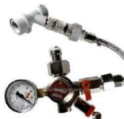
Article RP1102GN Régulateur de CO2 pour Soda-Club bouteille (Aluminium)