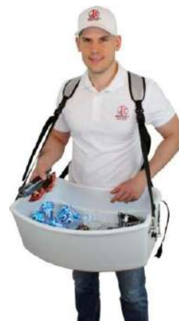
Ice-Cream-Plat excl. Sac en aluminium et couvercle coulissant