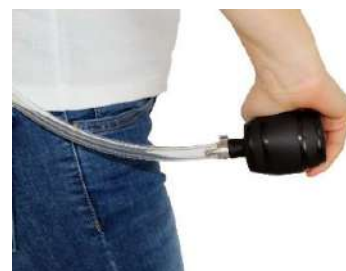
Fonctionnement avec mini-pompe à air comme équipement sous pression