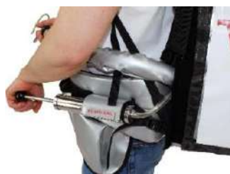
Pompe à air manuelle comme équipement sous pression

* Autres accessoires de pression sur demande*