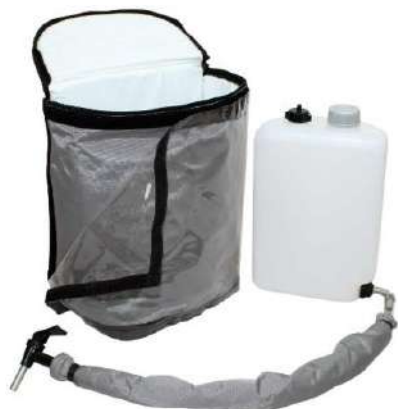
Illustration : caractéristiques du produit pour les boissons non gazeuses

Sac à dos de boisson simple, avec une isolation modérée, adapté à toutes les occasions amusantes. Convient de préférence aux boissons froides. Pour les boissons plates, la vidange fonctionne par gravité - aucun accessoire de pression supplémentaire n'est requis. Lorsque vous utilisez le sac à dos avec des boissons gazeuses, la mini-pompe à air doit être utilisée comme accessoire de pression.