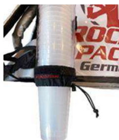
Distributeur de gobelets universel pour gobelets jetables et réutilisables