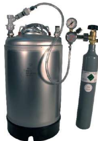
Article RP1102GN & Soda Club CO2-Cylindre attaché à Bidon de 11 litres