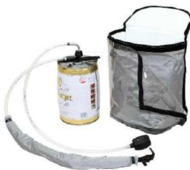
Contenu de la livraison : Party-Pack pour une canette de bière ALU de 5 litres