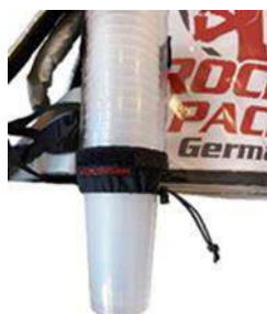
Distributeur de gobelets universel pour gobelets jetables et réutilisables

Sac à dos de boisson avec isolation (jusqu'à 2 heures). Pour servir deux types de produits à partir d'un sac à dos. Convient de préférence aux boissons froides. Fonctionnement par gravité des boissons non gazeuses, pas besoin d'utiliser un équipement sous pression supplémentaire. Distribution de boissons gazeuses, un équipement sous pression supplémentaire doit être utilisé. La pompe à air mécanique avec coupleur en T est la méthode la plus appropriée à cet effet. Idéal pour un service de boissons rapide !